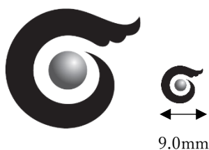
モノクロ（最小サイズ9.0mm）